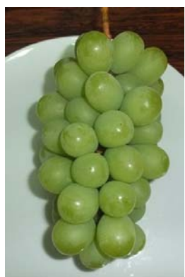
シヤインマスカット カラーチャート