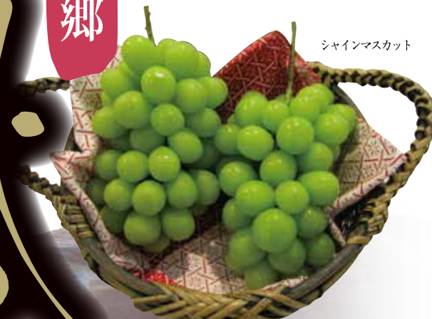
シャインマスカット