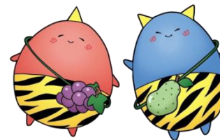
たかつき はたつき